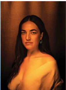
MARGUERITE : LE FEU