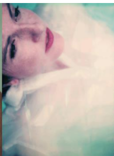
LES EAUX CLAIRES