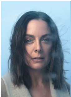
LES DIX COMMANDEMENTS DE DOROTHY DIX