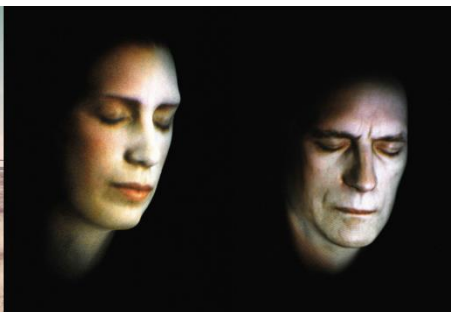
LES AVEUGLES + DORS MON PETIT ENFANT